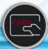
Tarjeta RFID Opcional