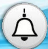
Sirena de horario